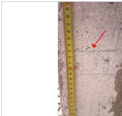
2025_Marque inconnue haute

SOURCE DE REPÉRAGE : RECENSEMENT PAR LE SPC MLA - 06/02/2024