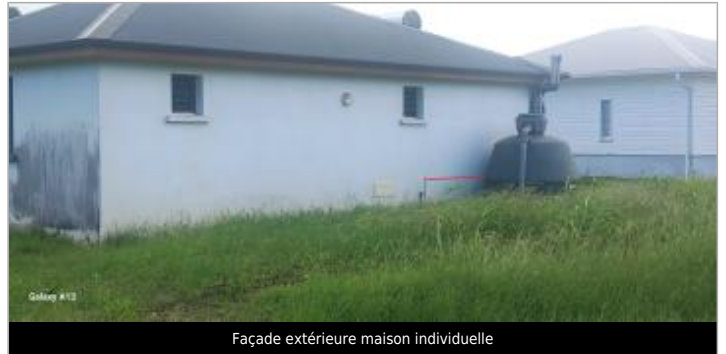
Façade extérieure maison individuelle