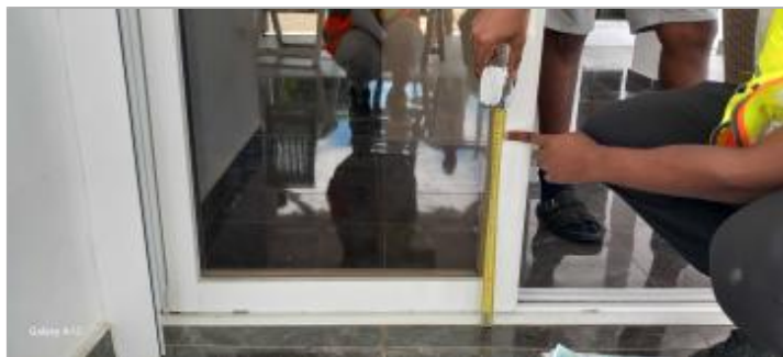
Dépôts de matières solides sur la baie vitrée