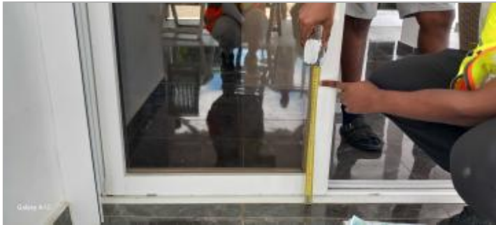
Dépôts de matières solides sur la baie vitrée