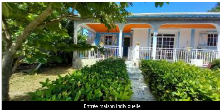
Entrée maison individuelle