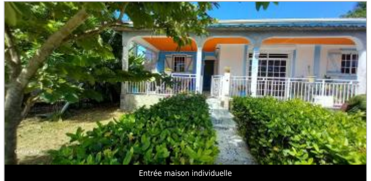
Entrée maison individuelle