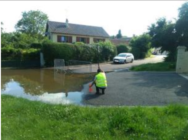
Vue du site, le 24/06/2024, SPC LACI

Altitude calculée de l'eau (en m) : 98.042