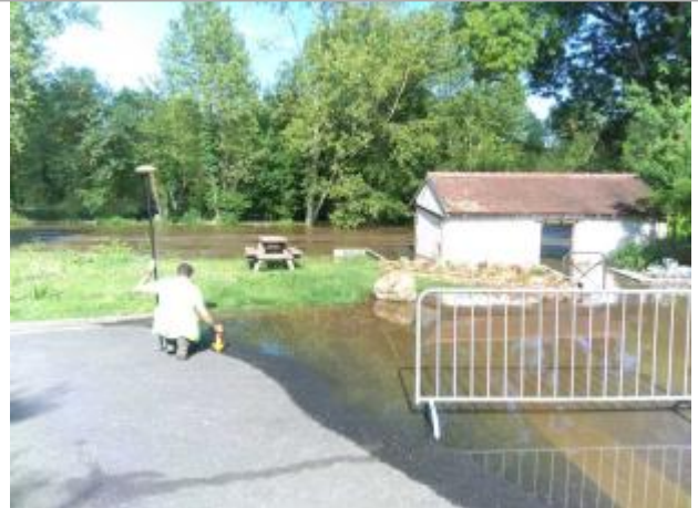
Vue du site, le 24/06/2024, SPC LACI

Coordonnées WGS84 : X: 2.02785000 / Y: 47.20619900