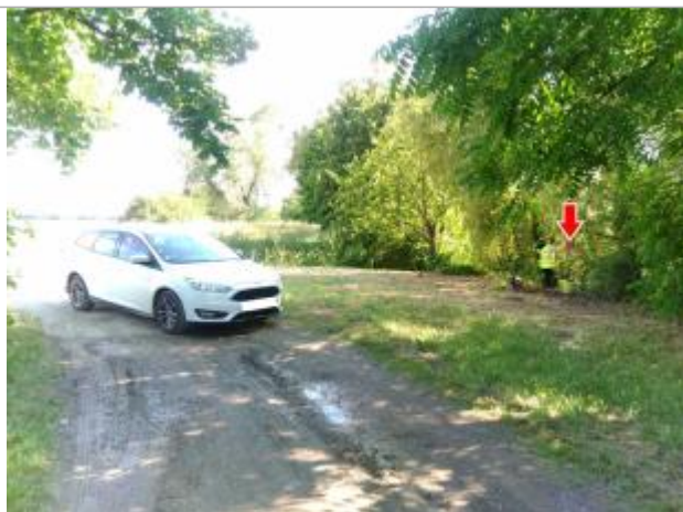
Vue du repère, le 24/06/2024, SPC LACI

Altitude calculée de l'eau (en m) : 100.687 m