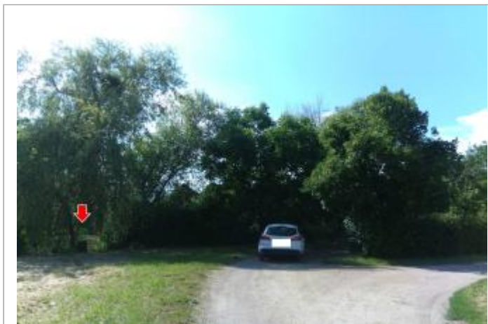
Vue du site, le 24/06/2024, SPC LACI