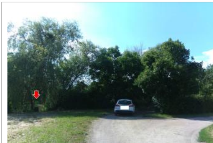
Vue du site, le 24/06/2024, SPC LACI

Coordonnées WGS84 : X: 2.03306300 / Y: 47.17847500