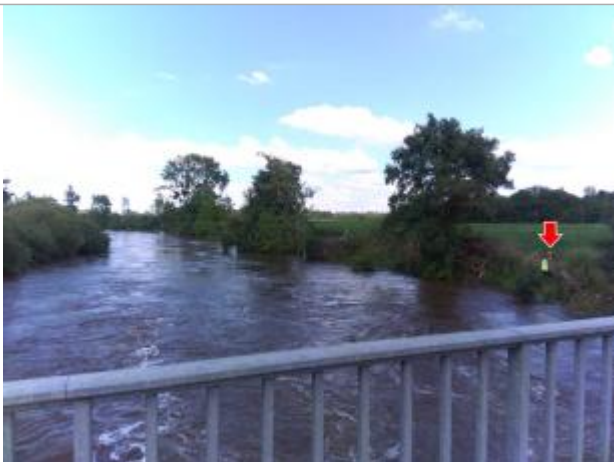
Vue du repère, le 24/06/2024, SPC LACI

Altitude calculée de l'eau (en m) : 104.278