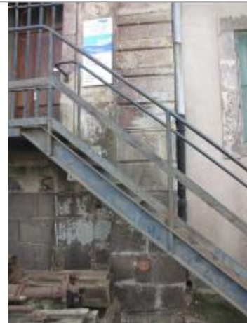
mur du bâtiment VNF