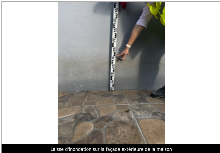
Laisse d'inondation sur la façade extérieure de la maison