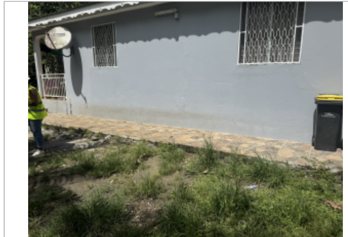
Façade extérieur de la maison à proximité de la route