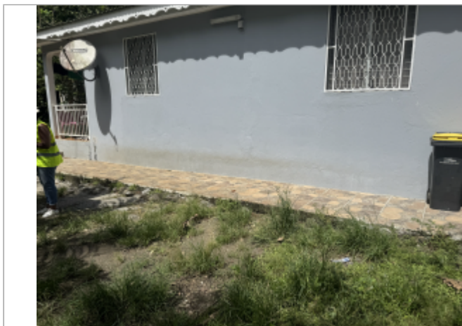
Façade extérieur de la maison à proximité de la route

Coordonnées WGS84 : X: -61.47184000 / Y: 16.26635000