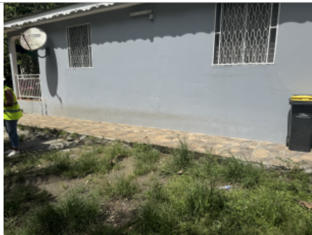
Façade extérieur de la maison à proximité de la route