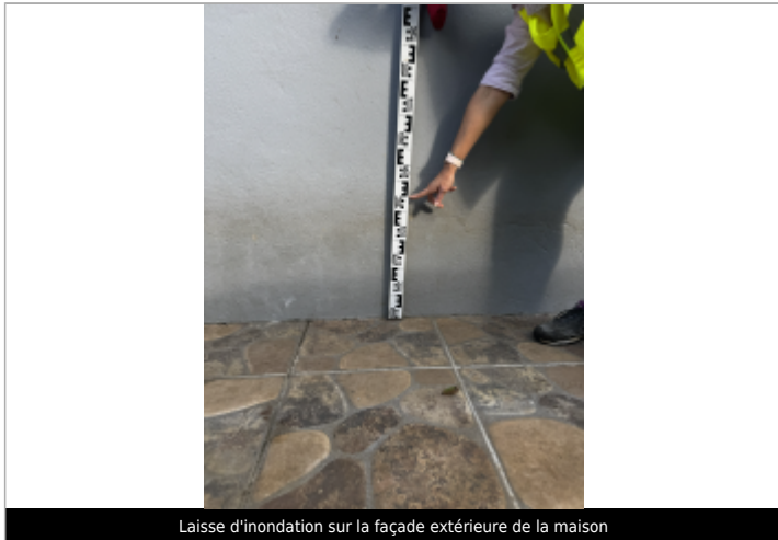
Laisse d'inondation sur la façade extérieure de la maison