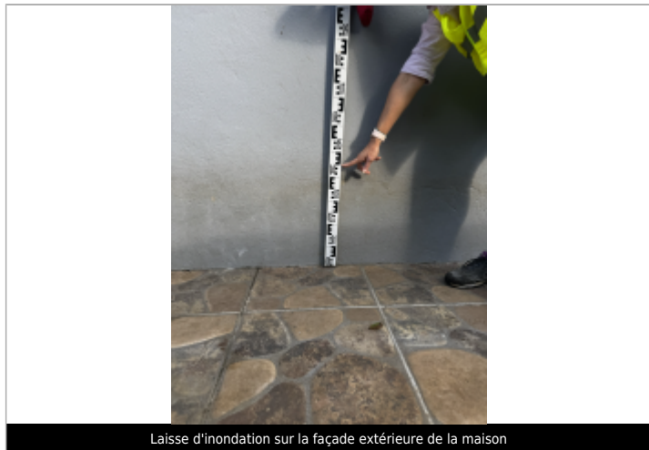
Laisse d'inondation sur la façade extérieure de la maison