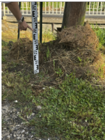
Laisse d'inondation en représentant pas une PHE