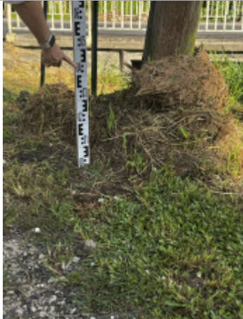
Laisse d'inondation en représentant pas une PHE