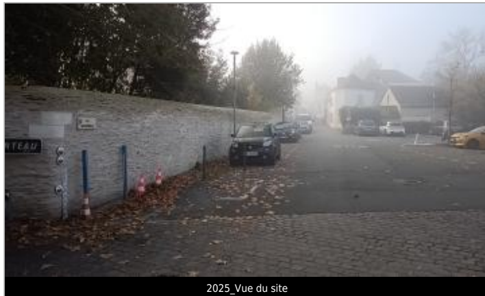
2025_Vue du site

Coordonnées WGS84 : X: -0.62157777 / Y: 47.40614000