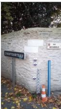
2025_Vue du repère

Altitude calculée de l'eau (en m) : 19.976 m