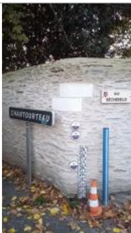
2025_Vue du repère

Altitude calculée de l'eau (en m) : 19.976 m