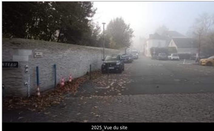
2025_Vue du site