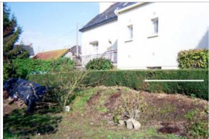
Arrière de la maison au n°7 rue du Lac à Rohan (repère inondation 2001)