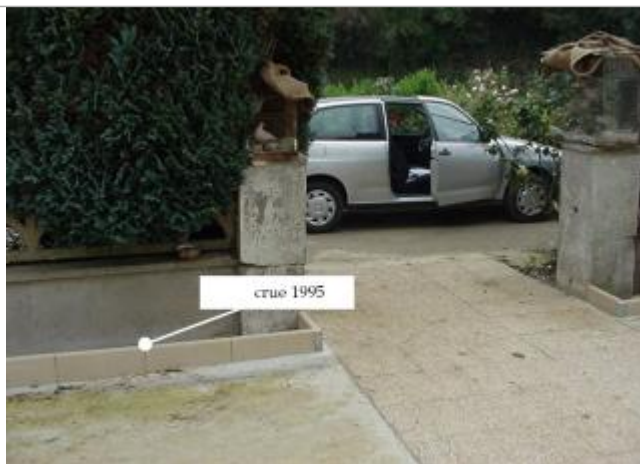
Relevé de la laisse d'inondation à l'entrée de la propriété

Altitude calculée de l'eau (en m) : 65.11