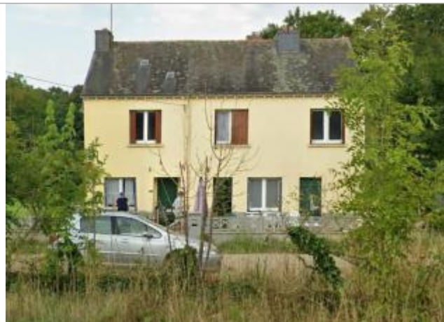
Maison au n°1 du lieu-dit "La Croix Neuve"

Coordonnées WGS84 : X: -2.76288318 / Y: 48.08272590