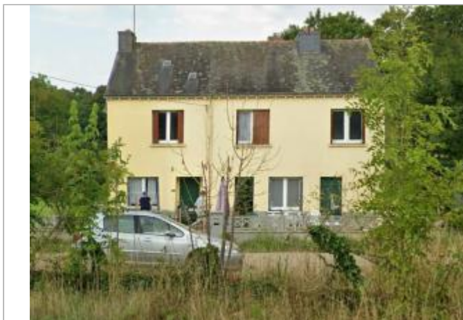
Maison au n°1 du lieu-dit "La Croix Neuve"

Coordonnées WGS84 : X: -2.76288318 / Y: 48.08272590