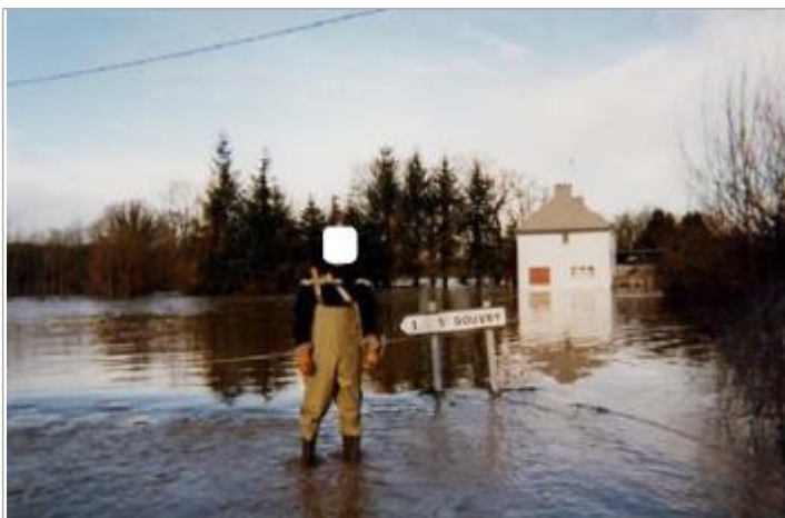
Photo au carrefour vers Saint-Gonery en décembre 1999 à la décrue

Type de repérage : Campagne de terrain post-inondation