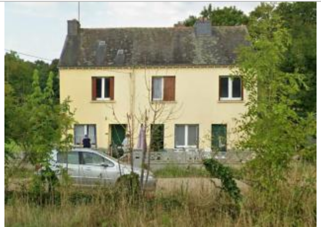
Maison au n°1 du lieu-dit "La Croix Neuve"

Coordonnées WGS84 : X: -2.76288318 / Y: 48.08272590