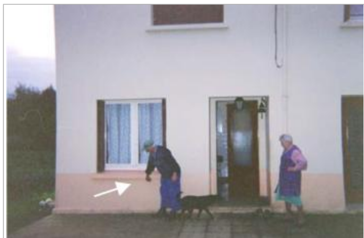
Témoignage de la hauteur de l'inondation de janvier 2001