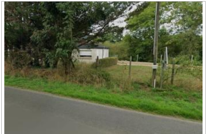
Maison au lieu-dit "La Croix Neuve"

GÉOLOCALISATION Coordonnées WGS84 : X: -2.76312356 / Y: 48.08316760 Coordonnées RGF93 (Lambert 93) X: 271244.04 / Y: 6791519.15 Coordonnées RGF93 (ETRS89) : X: -2.7631236 / Y: 48.0831676 Code Hydro: J8--0230 Rive de référence: Gauche