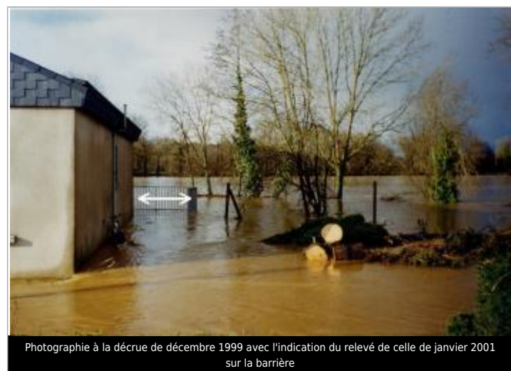
Photographie à la décrue de décembre 1999 avec l'indication du relevé de celle de janvier 2001 sur la barrière

GÉNÉRAL Code : RC_OUST_32_1999 Date de mise à jour : 18/11/2025 Auteur : SPC VCB