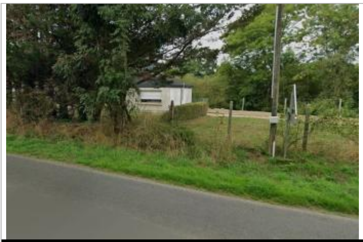
Maison au lieu-dit "La Croix Neuve"

GÉOLOCALISATION Coordonnées WGS84 : X: -2.76312356 / Y: 48.08316760 Coordonnées RGF93 (Lambert 93) X: 271244.04 / Y: 6791519.15 Coordonnées RGF93 (ETRS89) : X: -2.7631236 / Y: 48.0831676 Code Hydro: J8--0230 Rive de référence: Gauche