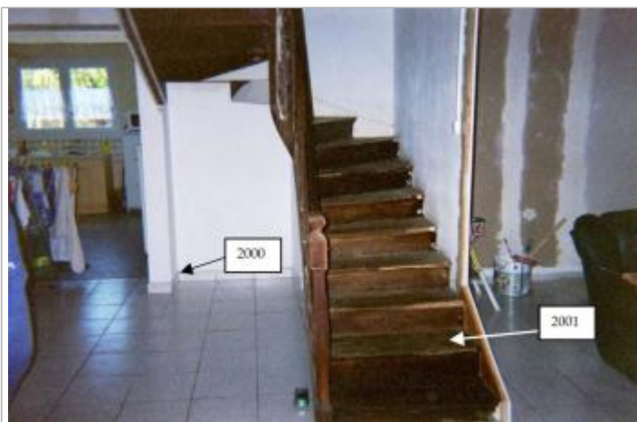
Relevé des laisses d'inondation de 2000 et 2001

Système altimétrique : NGF IGN 1969 (système normal)