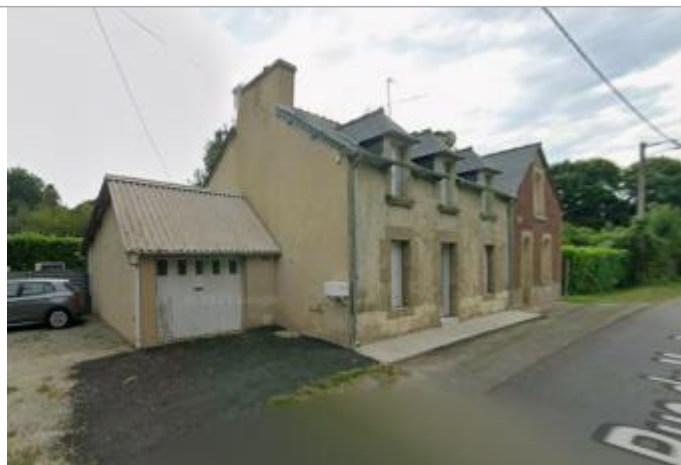
Maison au lieu-dit "Le Pré Marais" sur le bord de la rue du moulin