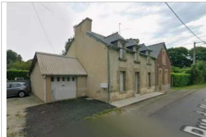
Maison au lieu-dit "Le Pré Marais" sur le bord de la rue du moulin