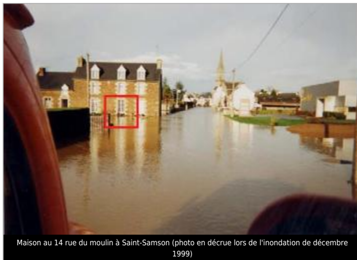
Maison au 14 rue du moulin à Saint-Samson (photo en décrue lors de l'inondation de décembre 1999)