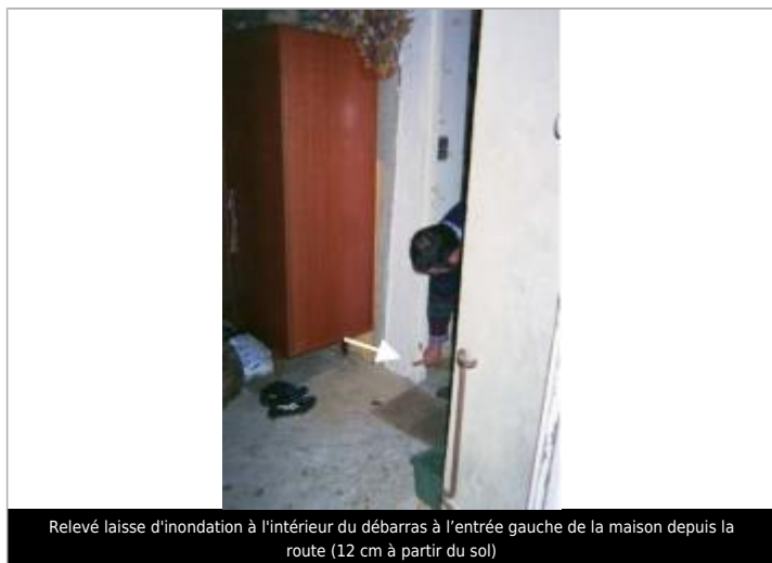
Relevé laisse d'inondation à l'intérieur du débarras à l'entrée gauche de la maison depuis la route (12 cm à partir du sol)

Différence entre le niveau d'eau et la référence (en m) : 0.120 m