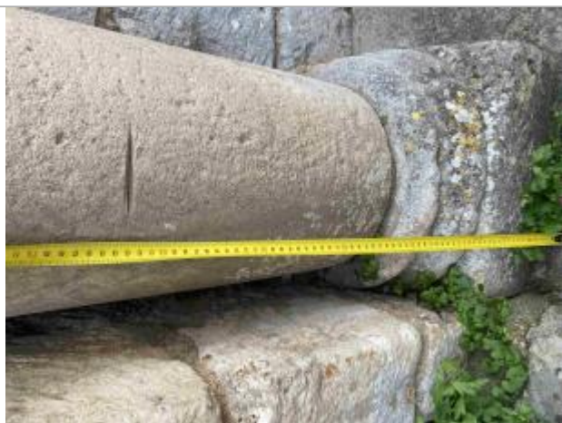
Vue sur la marque

Organisme(s) : Etablissement public du bassin de la Vienne