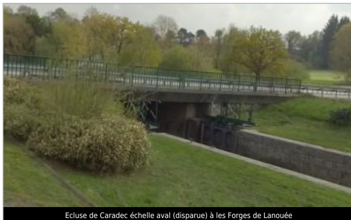
Ecluse de Caradec échelle aval (disparue) à les Forges de Lanouée

Coordonnées WGS84 : X: -2.57528536 / Y: 47.95309840