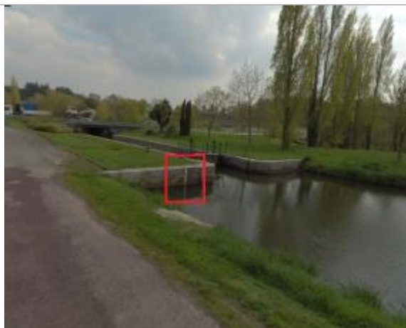
Ecluse de Caradec amont à les Forges de Lanouée