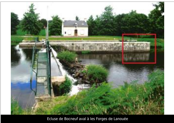
Ecluse de Bocneuf aval à les Forges de Lanouée

GÉOLOCALISATION Coordonnées WGS84 : X: -2.61248921 / Y: 47.95781750 Coordonnées RGF93 (Lambert 93) X: 281442.33 / Y: 6776817.72 Coordonnées RGF93 (ETRS89) : X: -2.6124892 / Y: 47.9578175 Code Hydro: J8--0230 Rive de référence: Gauche