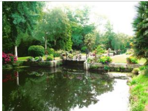
Ecluse du Lié amont à Bréhan