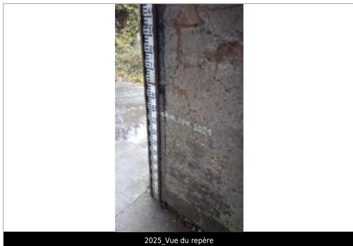
2025_Vue du repère

SOURCE DE REPÉRAGE : RECENSEMENT PAR LE SPC MLA - 06/02/2024