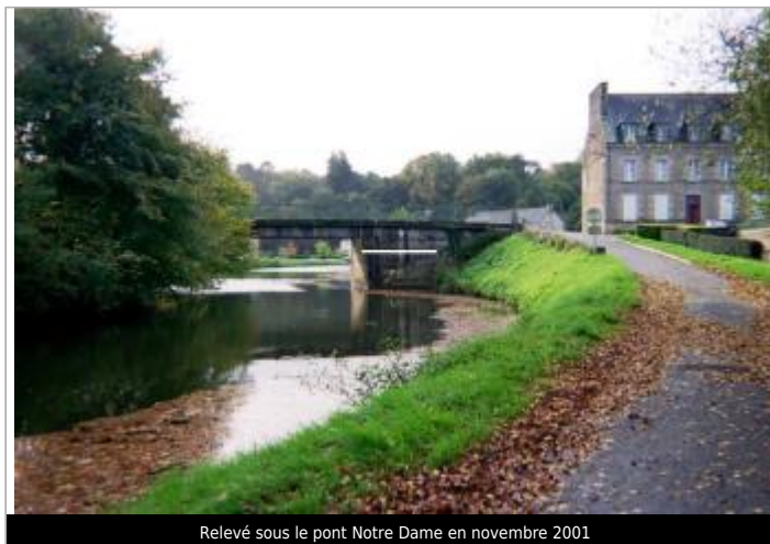
Relevé sous le pont Notre Dame en novembre 2001

Coordonnées WGS84 : X: -2.74966915 / Y: 48.06811820