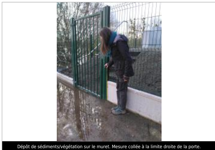
Dépôt de sédiments/végétation sur le muret. Mesure collée à la limite droite de la porte.

DGPS. RÉFÉRENCE NIVELÉE : SOL, AU PIED DU MUR (SITE). LC MESURÉE À 32,5 CM DU SOL. - 03/02/2025