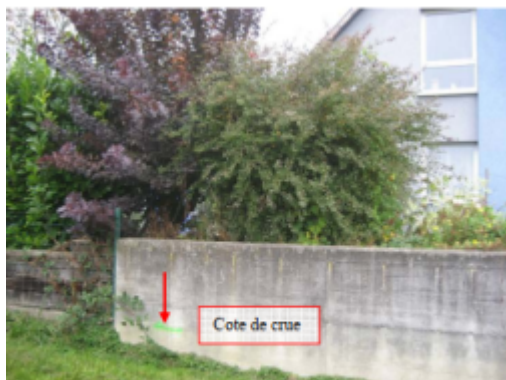
repère vert sur muret

Altitude calculée de l'eau (en m) : 280.73 m