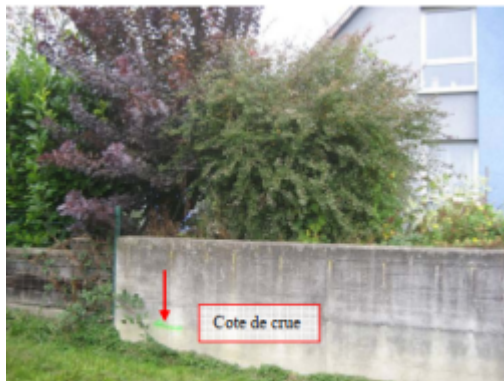
repère vert sur muret

Altitude calculée de l'eau (en m) : 280.73 m