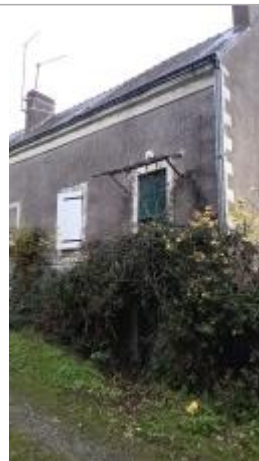
2025_Vue du site 1