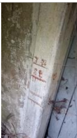
2025_Vue du repère

Altitude calculée de l'eau (en m) : 17.52 m