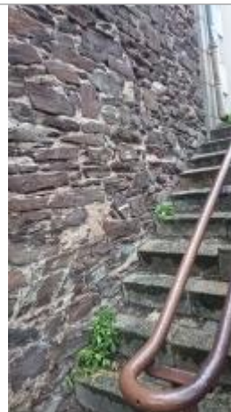
2025_Vue du site