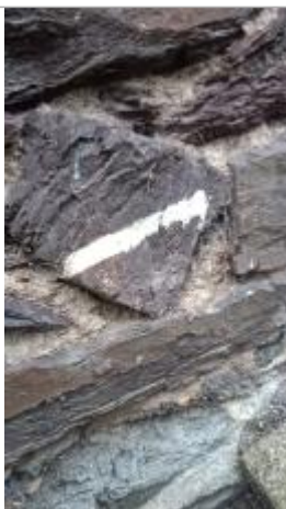
2025_Vue du repère

Altitude calculée de l'eau (en m) : 17.26 m