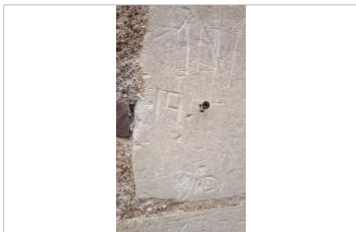
199. ? 1992 ? 1994 ?