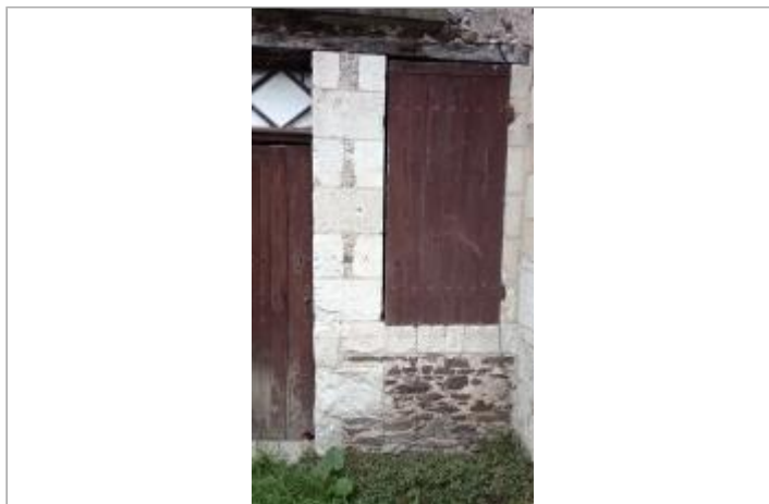
2025_Vue du site

Coordonnées WGS84 : X: -0.76884408 / Y: 47.36760970