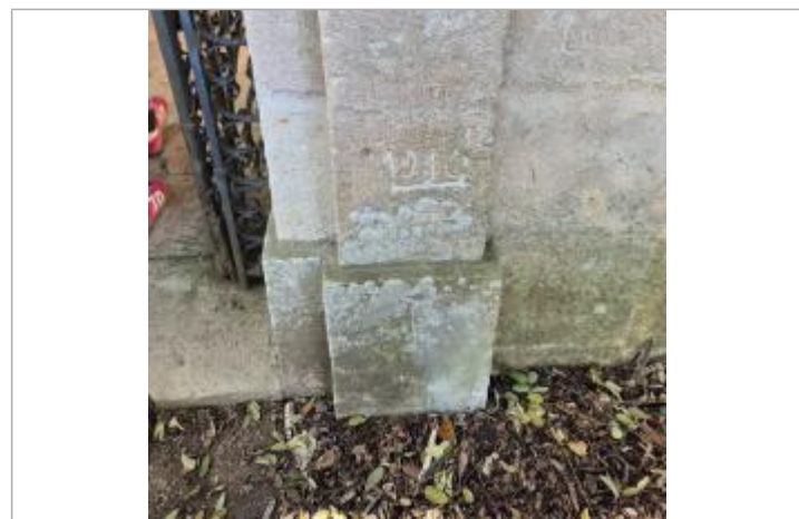
Photo du repère en novembre 2025