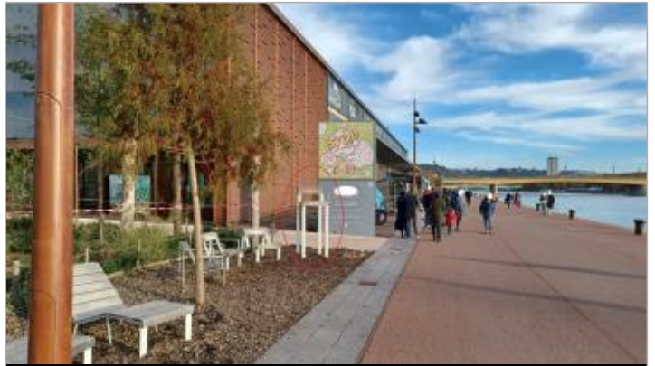
Vue depuis la promenade du Quai Rive Droite.

GÉOLOCALISATION Coordonnées WGS84 : X: 1.07706690 / Y: 49.44200130 Coordonnées RGF93 (Lambert 93) : X: 560506.63 / Y: 6928650.93 Coordonnées RGF93 (ETRS89) : X: 1.0770669 / Y: 49.4420013 Code Hydro : ----0010 Rive de référence: Droite