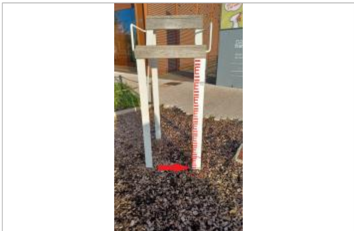
Laisse de crue à 5 cm/sol.

MARQUE Texte : 2024 Maximum de l'inondation : Oui Visibilité : Oui État du repère : Bon Pérennité : Longue Repère calculé : Non renseigné PHEC : Non