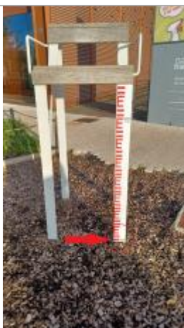
Laisse de crue à 5 cm/sol.