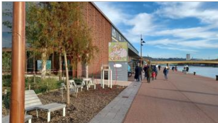
Vue depuis la promenade du Quai Rive Droite.

Coordonnées WGS84 : X: 1.07706690 / Y: 49.44200130