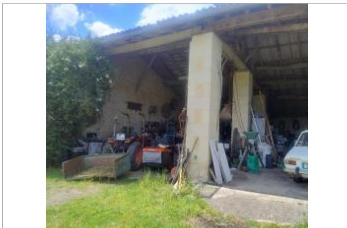
Vue sur le pilier central de la grange