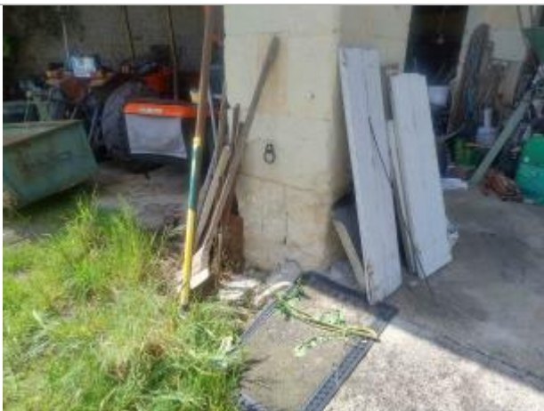
Vue sur l'anneau "marqueur visuel" de la hauteur d'eau

Organisme : Etablissement public du bassin de la Vienne