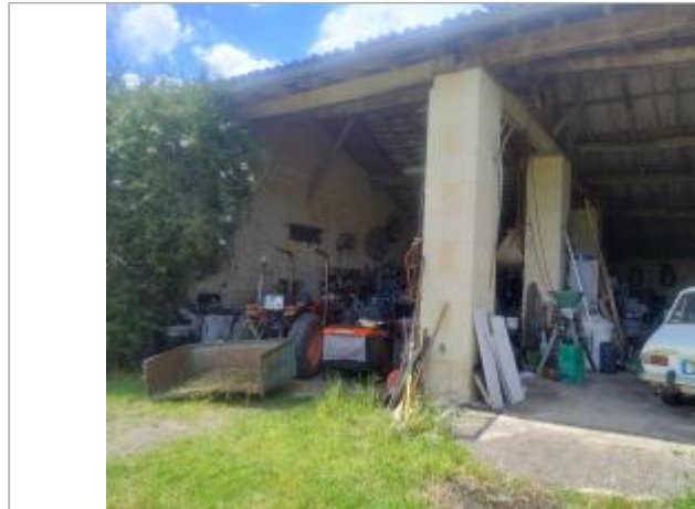
Vue sur le pilier central de la grange