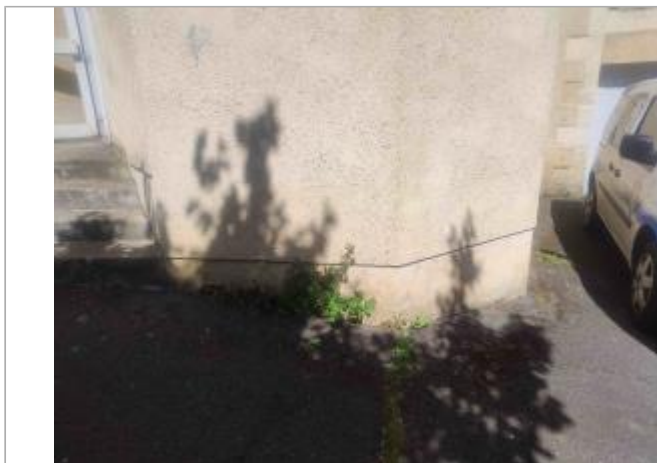
Support de la laisse d'inondation