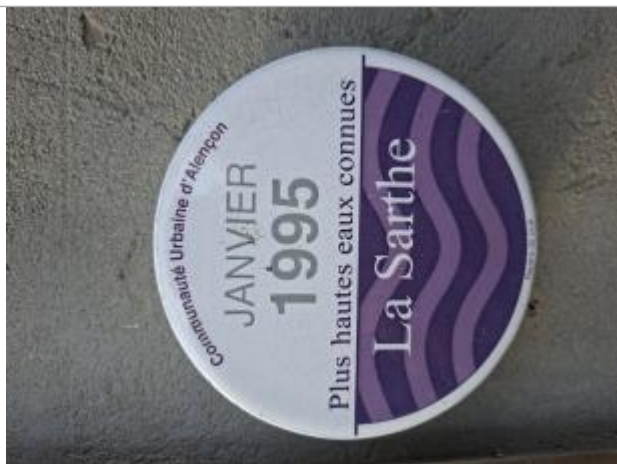
Repère de 1995

NIVELLEMENT RÉALISÉ PAR LE SPC MAINE LOIRE AVAL - 24/10/2025