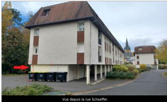
Vue depuis la rue Schaeffer.