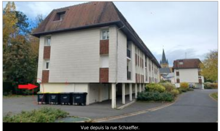
Vue depuis la rue Schaeffer.