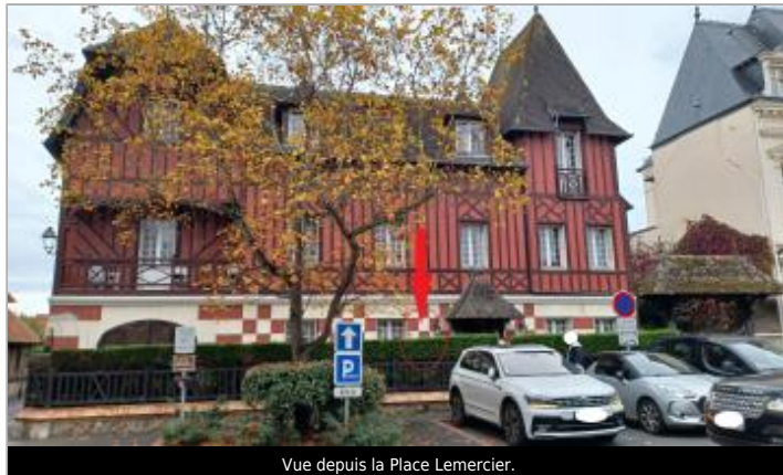
Vue depuis la Place Lemercier.