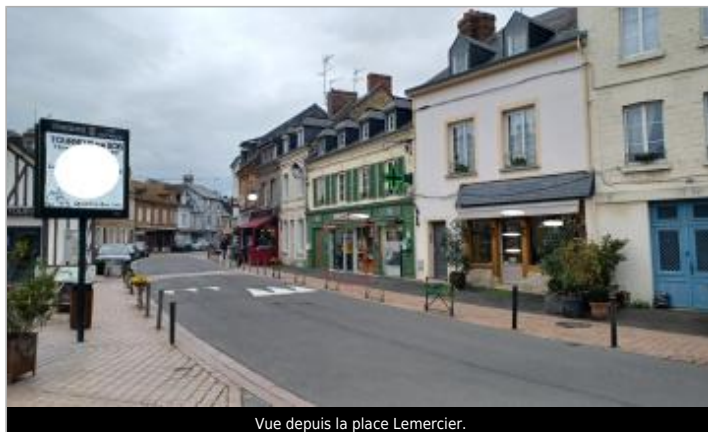
Vue depuis la place Lemer cier.