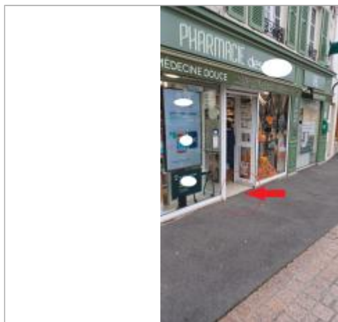
L'eau à atteint 15 cm au dessus du sol.

Altitude calculée de l'eau (en m) : 6.23 m