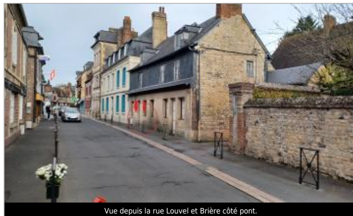
Vue depuis la rue Louvel et Brière côté pont.

GÉOLOCALISATION Coordonnées WGS84 : X: 0.10234268 / Y: 49.34306480 Coordonnées RGF93 (Lambert 93) X: 489420.78 / Y: 6919809.49 Coordonnées RGF93 (ETRS89) : X: 0.1023427 / Y: 49.3430648 Code Hydro: Rive de référence: Droite