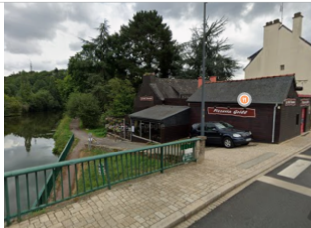
Bar le petit tonneau en aval du pont d'Oust à Rohan