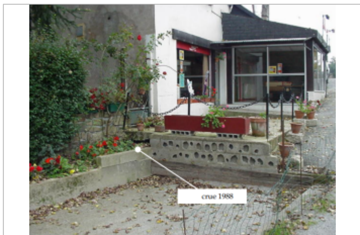
Muret du bar "le petit tonneau"

Altitude calculée de l'eau (en m) : 64.68