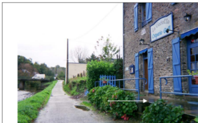
1995. Extérieur. Devant le canal. Chemin de halage (5 cm à partir du sol, soit 64.23 NGF)