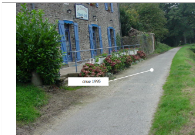
Niveau de l'inondation sur le chemin de halage devant la crêperie

Altitude calculée de l'eau (en m) : 64.23 m